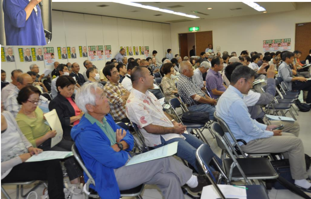
会場を埋めつくした約170名の参加者、メモをとる姿が目立ちました。